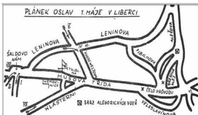
Jedno z nemnoha schémat plánované trasy prvomájového průvodu v Liberci, uveřejněných v tisku. (Stráž severu, 29. 4. 1950, s. 3)