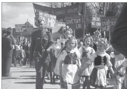
Krojované dívky v prvomájovém průvodu v Liberci v roce 1950.