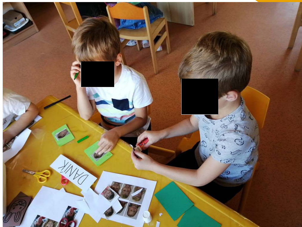
Pexeso s fotkami dětí