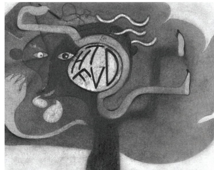
Nikola Čulík, Oblast Umění a kultura, kresba

A tak jsem připravila pár nápadů, na co by bylo možné se v hodinách výtvarné výchovy zaměřit a které by mohly učitelům usnadnit situaci, nebo je alespoň inspirovat.