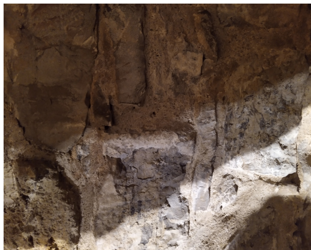
Ilustrační foto z archivu M. Pastorové