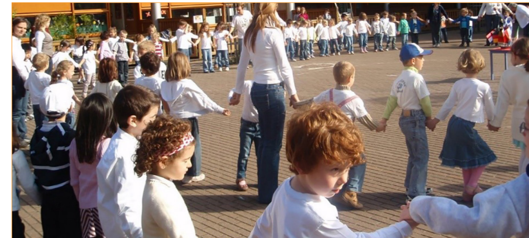
Vítání jara v bruselské škole